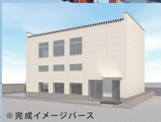
※完成イメージパース