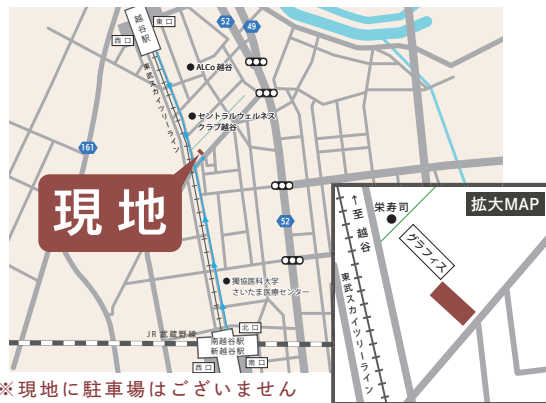
※現地に駐車場はございません