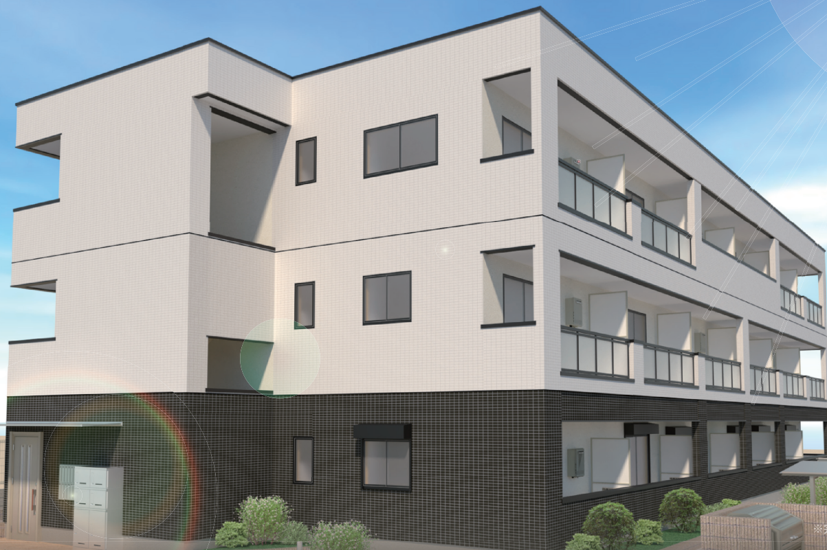
※完成イメージパース