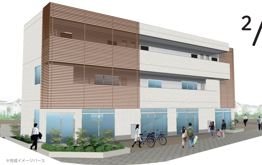
※完成イメージパース