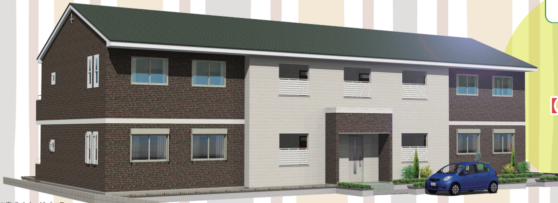
※完成イメージパース